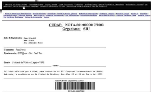
Ejemplo de carátula de una nota ▶