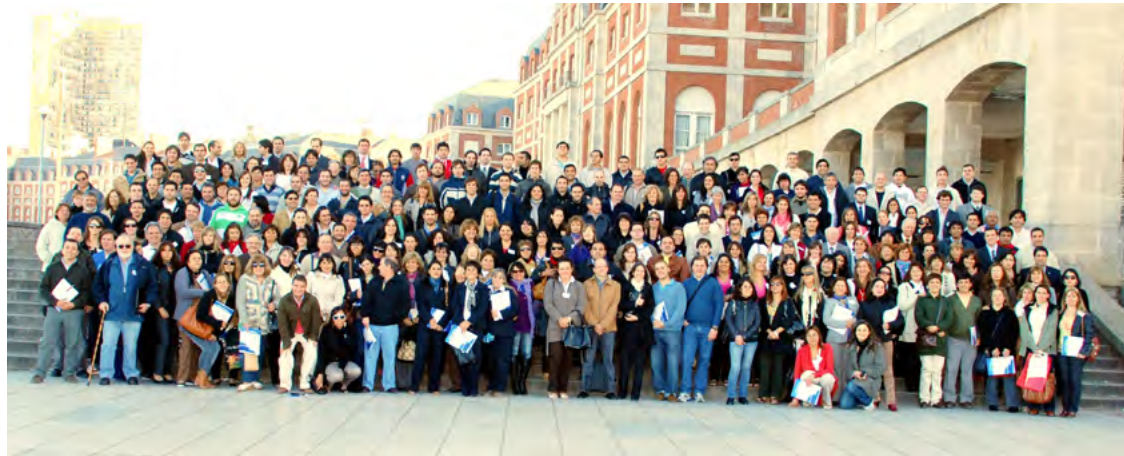
PRIMER TALLER ANUAL - UNIVERSIDAD NACIONAL DE MAR DEL PLATA (2010)