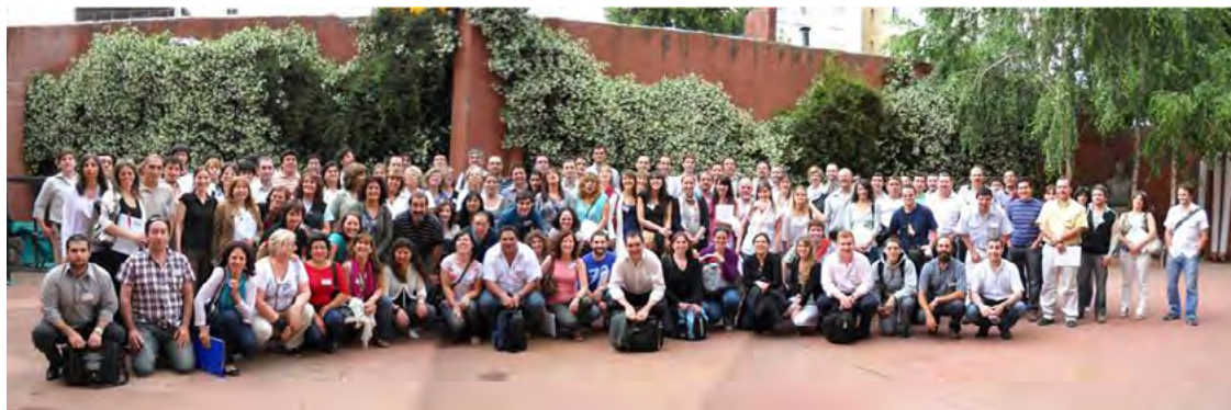
TALLER ANUAL 2010 - SIU-GUARANÍ Y SIU-KOLLA