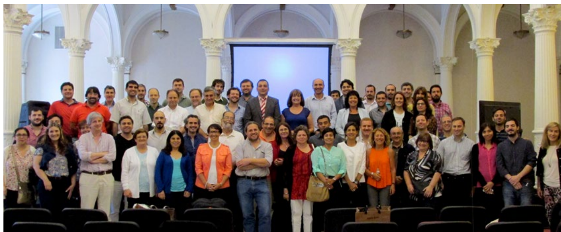
TALLER ADMINISTRACIÓN ELECTRÓNICA 2015